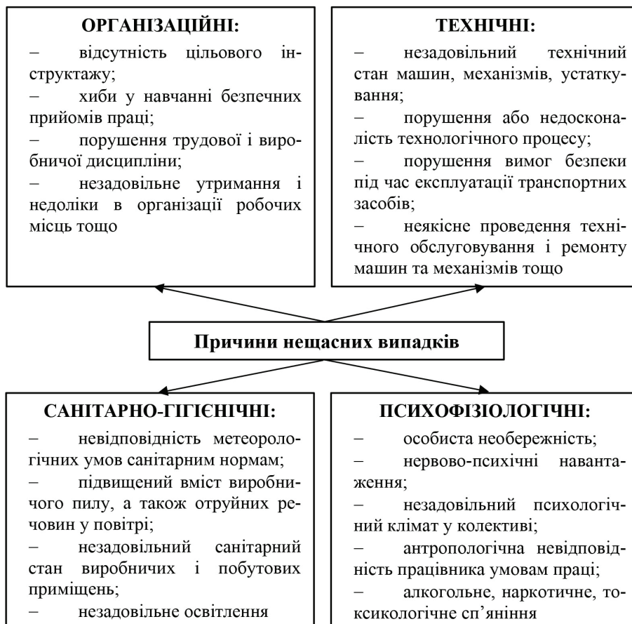
Рис. 1. Причини нещасних випадків

Виклад основного матеріалу дослідження. Як показує практика, істотну частку всіх небезпечних випадків, професійних захворювань можна було б попередити і не допустити. Основними заходами організації безпечних умов праці ще до початку трудової діяльності є проведення інструктажів, навчання безпечних прийомів виконання робіт усіх працівників, зокрема керівників організацій, а також роботодавців. На рис. 1 наведені причини нещасних випадків, які поділяються на організаційні, технічні, санітарно-гігієнічні та психофізіологічні.