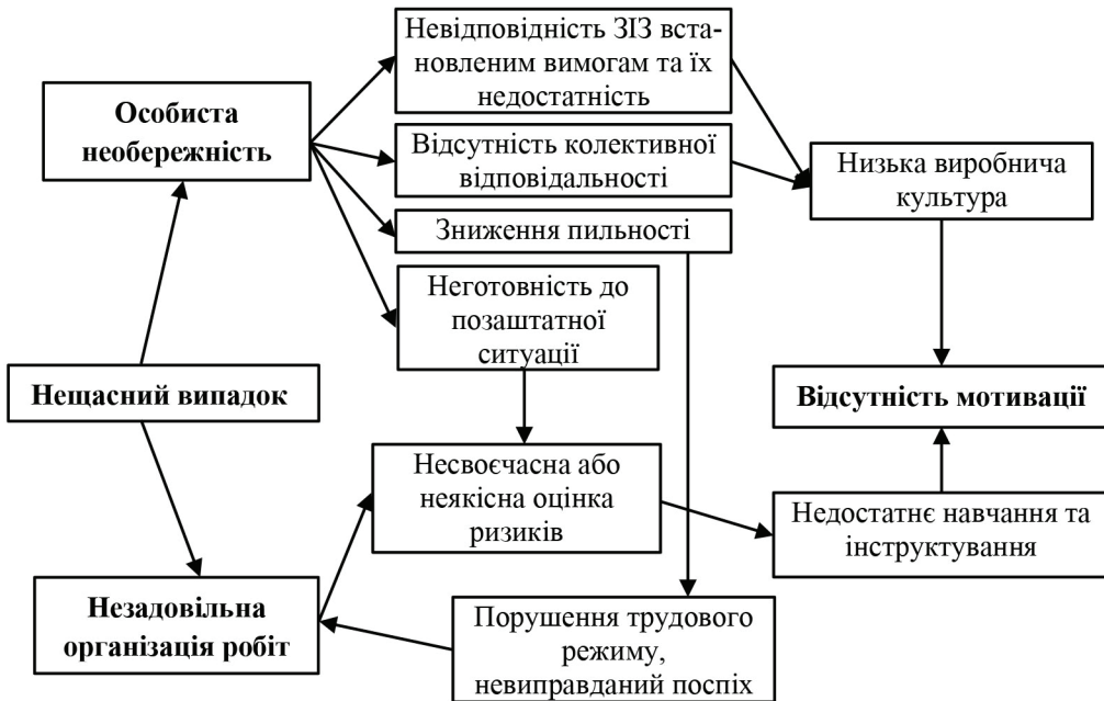
Рис. 3. Модель взаємодії ключових проблем забезпечення безпеки праці

Грамотна мотиваційна політика на підприємстві має бути комплексною та торкатись всіх необхідних щаблів під час організації робіт. На підставі проведеного аналізу встановлено взаємозв'язок ключових проблем та зображено їх взаємодію у вигляді моделі (рис. 3) для організації збалансованої системи управління охороною праці.