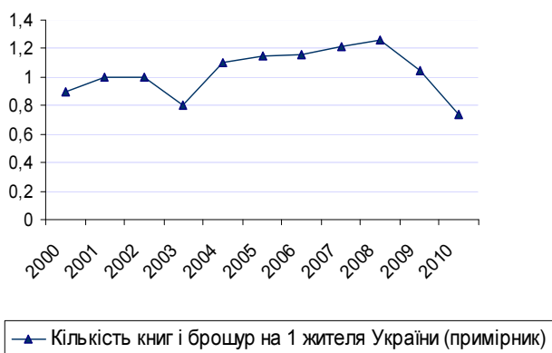
Рис. 1. Динаміка випуску книг за кількістю примірників на одного мешканця України у 2000–2010 рр.

Структурні зміни на книжковому ринку країни за останнє десятиріччя помітно вплинули на продуктивність книговидавництва. Універсальним показником динаміки книговидавництва є кількість назв виданих книжок, тому цей показник визначає розмаїття інформаційних документів, які виходять кожного року в суспільний обіг. На рис. 2. представлено динаміку випуску книг за назвами та тиражами в Україні у 2000–2010 рр. [2].