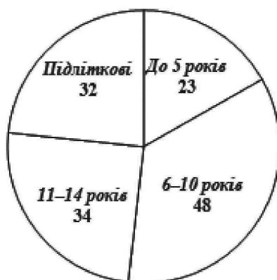
Рис. 4. Розподіл журналів за віковою ознакою (кількість назв)