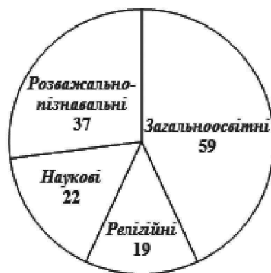
Рис. 5. Розподіл журналів за читацьким призначенням (кількість назв)