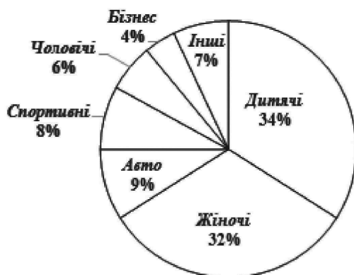
Рис. 3. Розподіл аудиторії журнального ринку України